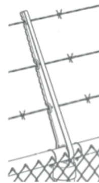
Support de fil incliné